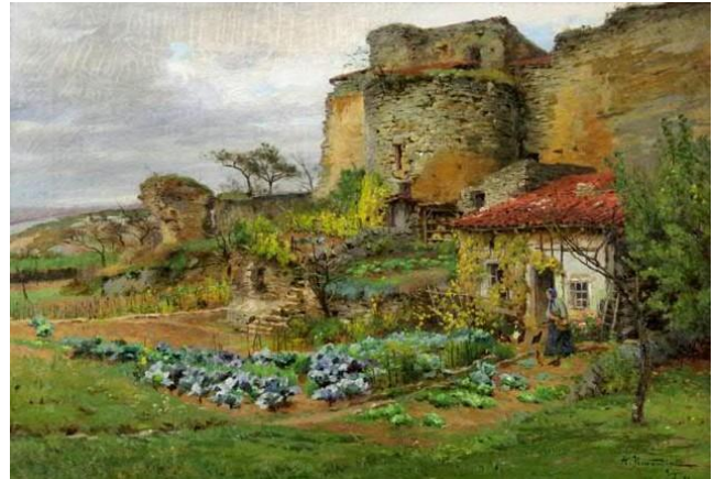
Deux toiles représentant le château de Moyen par Alfred RENAUDIN

16h-16h30 : Mairie de Gerbéviller : en lien avec le Centenaire du Martyr de Gerbéviller, nous serons reçus dans la salle d'honneur pour y admirer les six tableaux de Renaudin évoquant cette page sombre de l'Histoire.