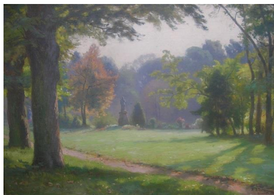
Le château de Lunéville et le parc des Bosquets peints par Alfred RENAUDIN