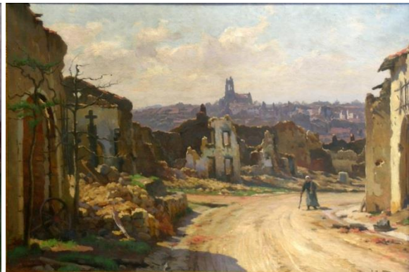
Le martyr de Gerbéviller peint par Renaudin en 1915. Musée du château de Lunéville

Le prix total de cette journée, sans repas et sans transport, est fixé à 6 € .